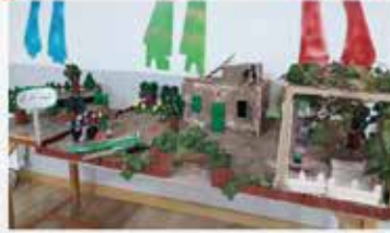
البيت الترابي المَبْرَقِي