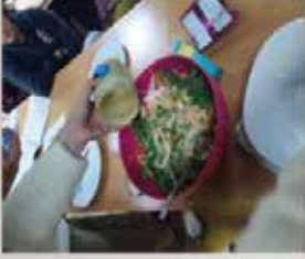
وصفة طعام آسيوتية

نصائح من خبرة في الذوق والسلوك باللغة الفرنسية ليقوم الطلاب في ما بعد بكتابة تقرير مفصل باللغة العربية عن ما ورد في تفاصيل الحلقة