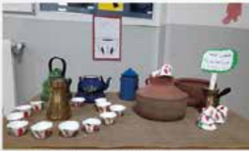
فناجين القهوة المَبْرَقِيّة - صناعة يدويّة