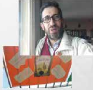
لقاء مع الكاتب أنطوان الشرتوني